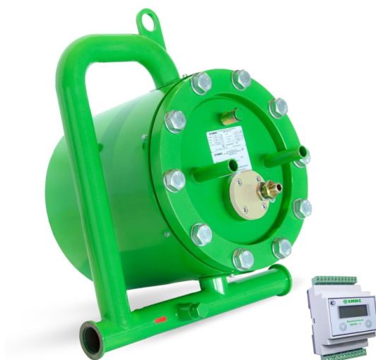
Рисунок 2 - Общий вид счетчиков раздельного исполнения Схемы пломбировки счетчиков приведены на рисунках 3-4.