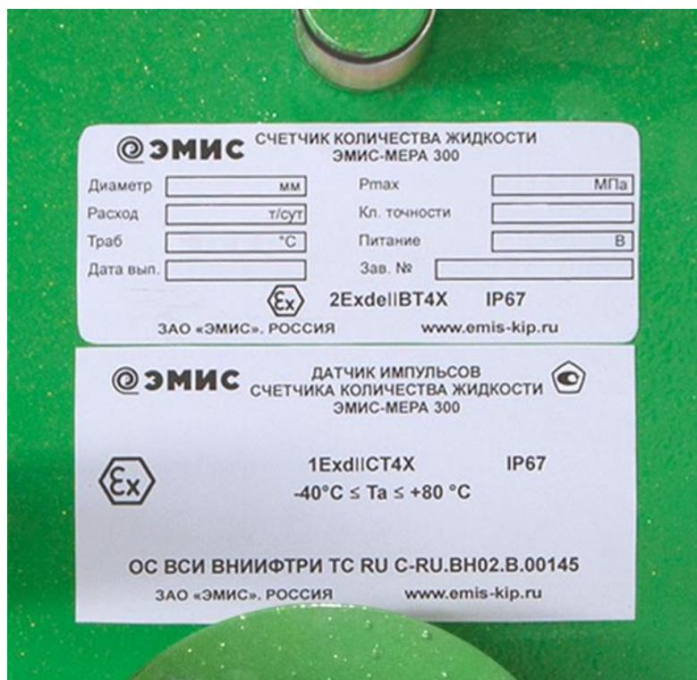
Рисунок 5 - Маркировка, наносимая на корпус счетчиков

Маркировка, наносимая на счетчики, приведена на рисунке 5.