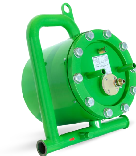
Рисунок 1 - Общий вид счетчиков моноблочного исполнения

Общий вид счетчиков приведен на рисунках 1-2.