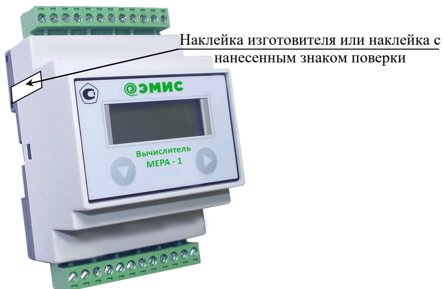
Рисунок 4 - Схема пломбировки вычислителя счетчиков раздельного исполнения